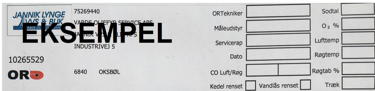
FIGUR 1 EKSEMPEL PÅ OR-MÆRKAT

Der opsættes et mærkat på alle anlæg, som skorstensfejeren kan følge op på eller, i tilfælde af manglende/forældet mærkat, kan tilbyde energimåling udført ved den lovpligtige skorstensfejsning.