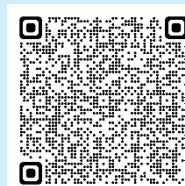
QR-kode til kursus

Årets første uddannelsesforløb i oliefyrsteknik < 100 kW kørte i starten af året og det næste forløb er slået op på hjemmesiden hos EUC-Syd. Kurset kører 8. august – 2. september. Der er 12 pladser som besættes efter først-til-mølle-princippet.